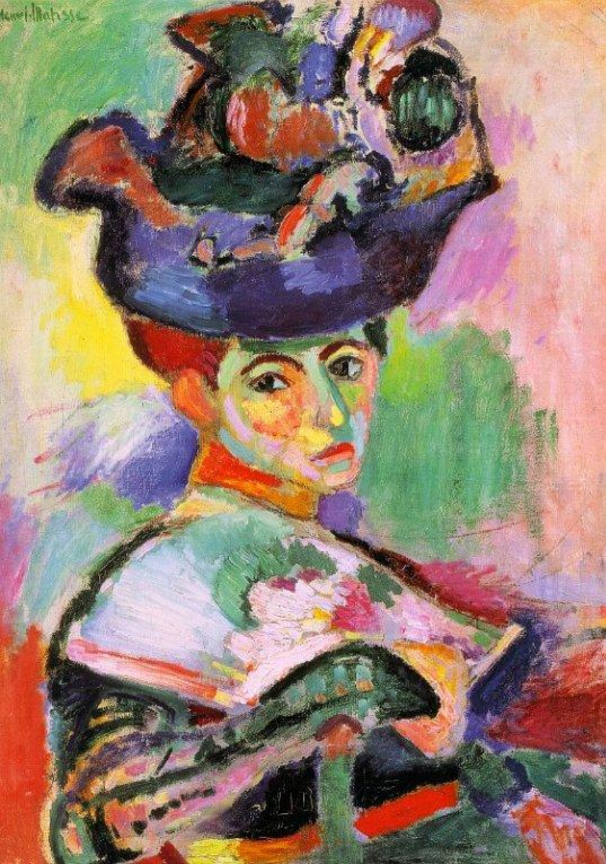
Henri Matisse, Kobieta w kapeluszu, 1905