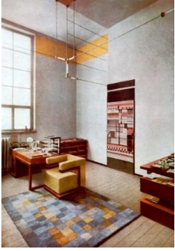
Marcel Breuer, Krzeseł Wassily , 1925