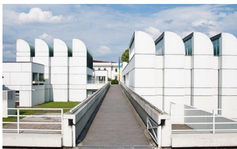
Budynek Archiwum Bauhausu w Berlinie

Znamienne wydają się być okoliczność realizacji Bauhausu. Wobec problemów finansowych z jakimi borykała się szkoła, Gropius zdecydował się na sprzedaż zastawy stołowej Napoleona Bonaparte, która była w posiadaniu jego rodziny od pokoleń. Wielu historyków architektury potraktowało ten gest symbolicznie, jako wiele mówiący o stosunku awangardy do historii.