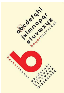
Herbert Bayer, projekt czcionki

Bayer był austriackim artystą i projektantem, który pierwotnie przybył do Bauhausu jako student, a później zajął stanowisko nauczyciela, gdy szkoła przeniosła się do Dessau. Wielu niemieckich projektantów usiłowało zachęcić do zmian w krajowych zwyczajach drukowania w latach dwudziestych. Do tej pory najbardziej popularne niemieckie kroje pisma były pod wpływem średniowiecznego pisma, ale artyści tacy jak Bayer starali się wypierać je prostszymi, bardziej klasycznymi wzorami. Ta konstrukcja wykorzystuje minimalną czcionkę bezszeryfową. Zamiast dwóch alfabetów, jednej dużej i jednej małej, Bayer korzystał tylko z małych liter. Uważał, że wielkie litery były zbędne, ponieważ rozróżnienie między dużymi i małymi literami nie miało różnicy fonetycznej. Krój pisma Bayera stał się odąd synonimem Bauhausu.